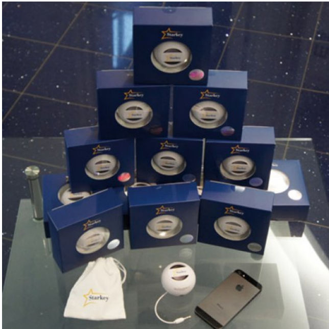
Starkey Boomball - praktischer Mini-Lautsprecher für unterwegs